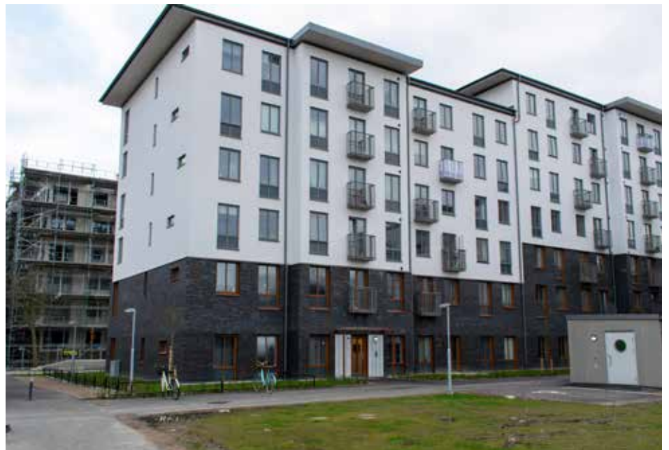
De nya flerfamiljshusen vid Dalbyvägen i Arlov.

Ett annat stort byggprojekt är kommunens nya bad. Bygget, som startade i slutet av 2019 löper på väl och schaktarbe-