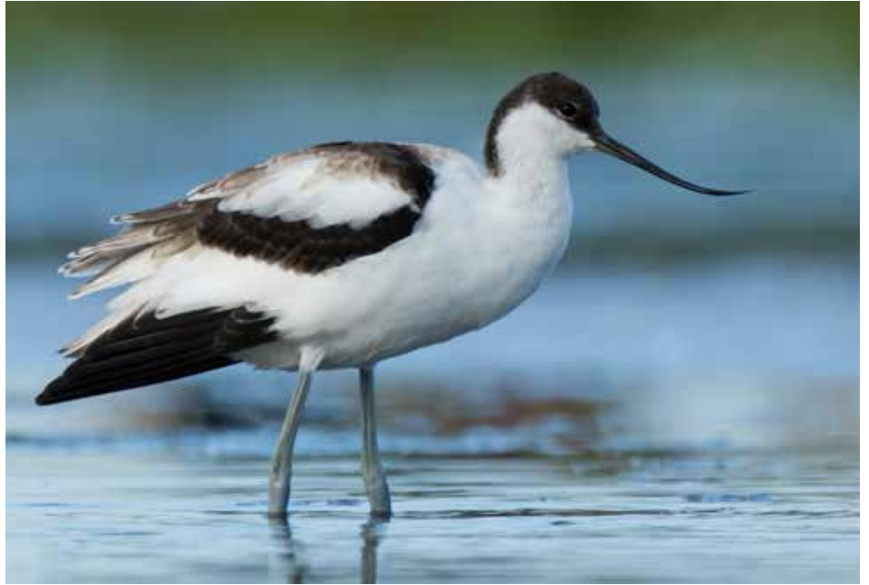
Burlövs kommunfågel Skärfläckan som du bland annat kan få syn på ute på Spillepeng.

Vidare från golfbanan ner mot Stora Bernstorps handelsområde hittar du