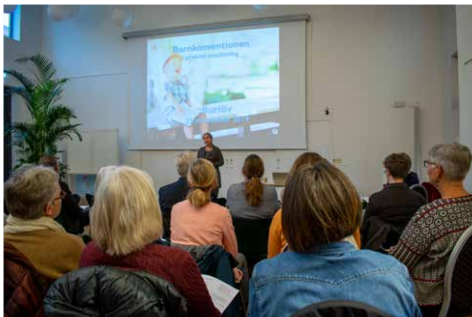
Utbildning för kommunens politiker.

I Burlöv har vi jobbat länge med barnrättsperspektivet och med de senaste utbildningsinsatserna har vi fått igång diskussioner som kan resultera i att arbetet förstärks ytterligare.