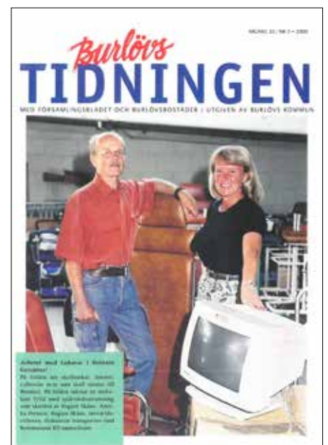
Så här såg Burlövstidningen ut år 2000.

Ett exemplar av de flesta numren finns i kommunens arkiv. De första åren kom tidningen ut två-tre gånger per år, sedan har det varierat mellan 4 till 11 nummer under årens lopp. Formatet har varit detsamma under de här femtio åren med undantag för 2006-11 då Burlövstidningen var några sidor som en del av tidningen Spegeln. Idag kommer Burlövstidningen ut med 8 nummer per år.