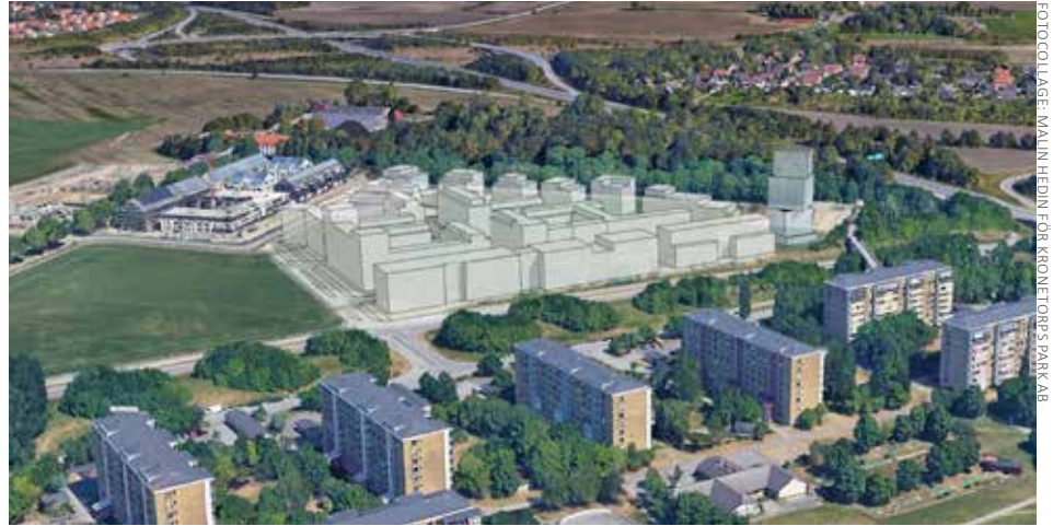
Skiss för hur andra etappen av utbyggnaden av Kronetorpstaden kommer att se ut.