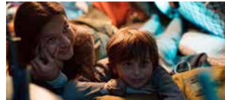
Från filmen Ensamma i rymden.

Från 7 år. Åkarps bibliotek, kl. 15.00. Arr: Biblioteken i Burlöv.