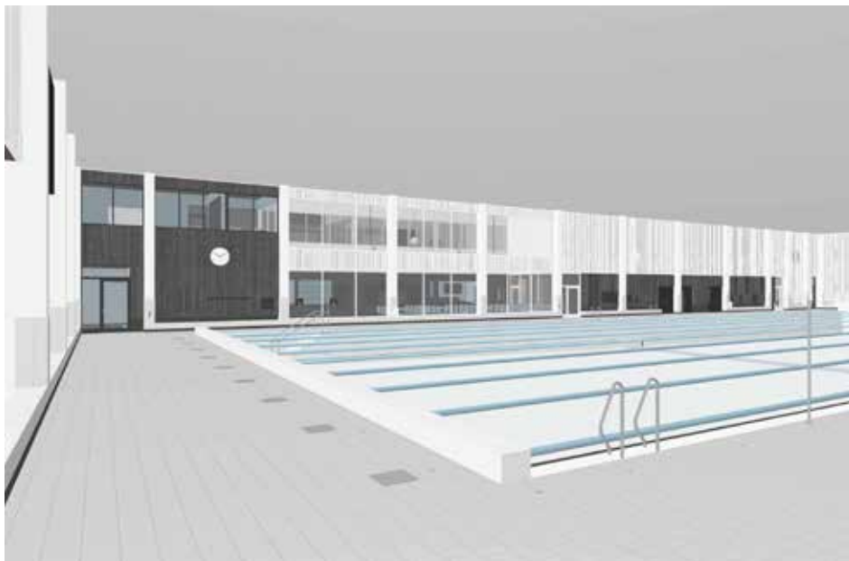
ILLUSTRATIONER: LILJEWALL ARKITEKTER

Kommunens verksamheter, samt den aktiva simklubben som hyr lokaler av kommunen idag, har varit involverade i utformningen av det nya badet. När det är färdigställt kommer det att innehålla en 50-metersbassäng som vid behov kan delas av till två 25-metersbassänger, en undervisningsbassäng, en multibassäng med höj- och sänkbar botten samt en barnbassäng. Simklubben kommer att få egna lokaler på plan 2 tillsammans med badpersonalens utrymmen. Det förbereds även lokaler för ett gym på plan 2. På entréplan blir det reception och café.