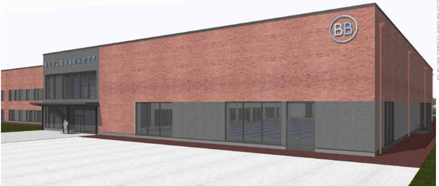
ILLUSTRATIONER: LILJEVALL ARKITEKTER

Huvudentrén för nya Burlövsbadet som ska vara färdigt i början av 2022. Badhuset ska kunna ta emot 200 000 gäster varje år.