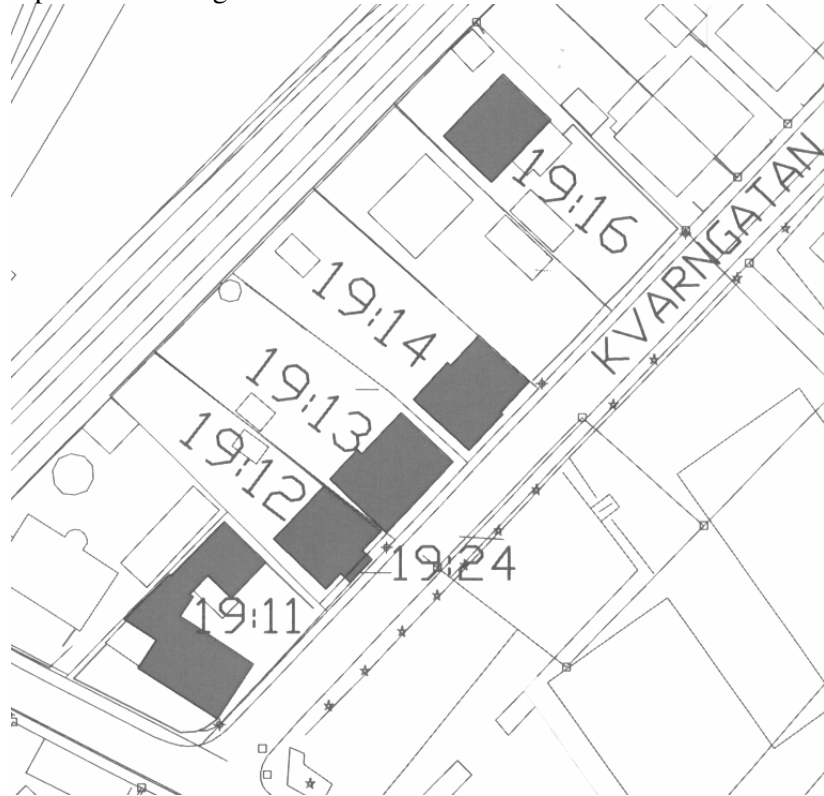
Område 3, Kvarngatan. I illustrationen är berörda byggnader inritade med mörkare ton.

Tillägg till detaljplanen gäller fastigheterna i tabellen på sidan fyra i planbeskrivningen.