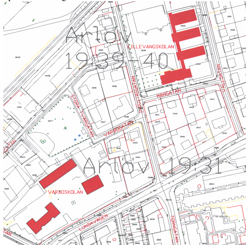
Område 5, Skolmiljön Vårbo – Lillevång. I illustrationen är berörda byggnader markerade med mörkare färg.

Tillägg till detaljplanen gäller fastigheterna i tabellen på sidan fyra i planbeskrivningen.